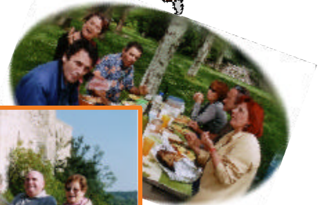
Pique-nique à deux pas de la cathédrale St Bertrand du Comminges.