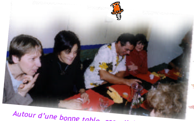
Autour d'une bonne table, accueil de nouvelles adhérentes lors de la dernière soirée.

Les fêtes de Noël approchant, les adhérents de l'AMDS ont souhaité profiter d'un avant-goût de ces festivités autour d'une table bien connue, celle de « La Mounède », sans oublier la