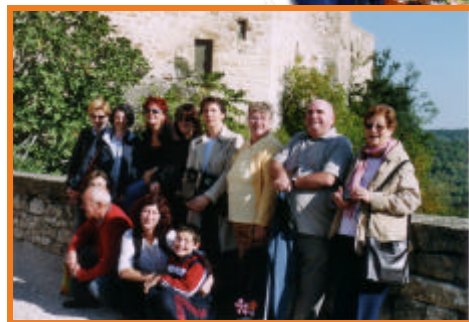
Au pied du Château de Bruniquel.

Après le discours d'introduction de la présidente P. Duffaut, le plaisir de la table, l'intensité des échanges entre les adhérents et les blagues de Lulu ont agrémenté cette belle journée ensoleillée.