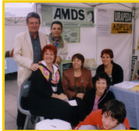
Le 7 octobre, place du Capitole : des adhérents devant le stand de l'AMDS.

Plus d'une centaine d'associations ont ainsi constitué sur la place du Capitole un véritable village associatif : une riche rencontre inter-associative avec le public, l'occasion d'échanger, d'écouter et de mieux faire connaître nos actions et nos engagements.